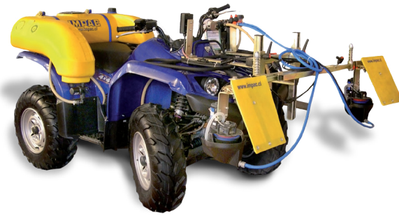
Bomba eléctrica 12v